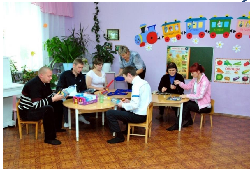
В клубе «Малышкина школа»