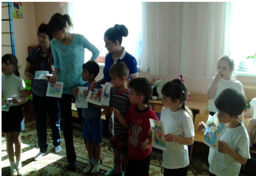
Реализация проекта «Здоровый дошкольник»