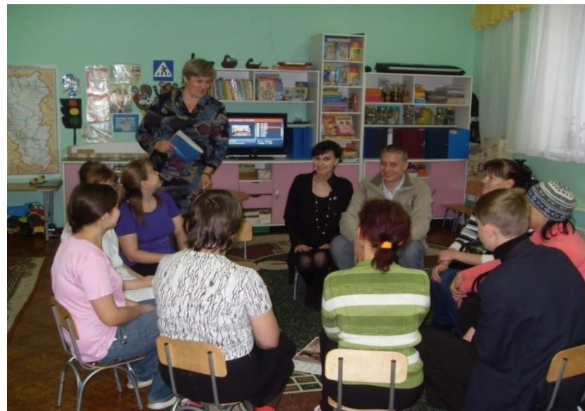
Реализация проекта «Моя семья»