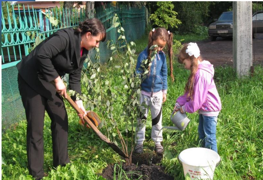
Благоустройство территории ДООУ